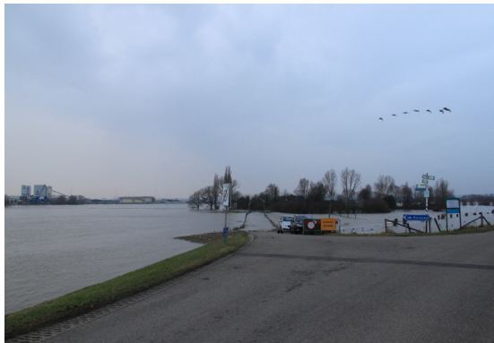
BRON 4 Afgesloten toegangsweg tot het Looveer bij Westervoort via een terp in de uiterwaard. 17 januari 2011.