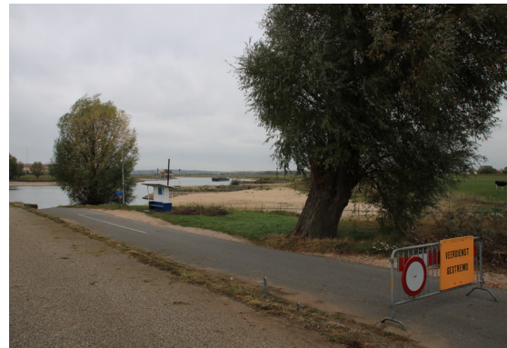
BRON 5 Afgesloten toegangsweg tot het Looveer bij Westervoort aan de gedeeltelijk drooggevallen rivier. 26 oktober 2018.